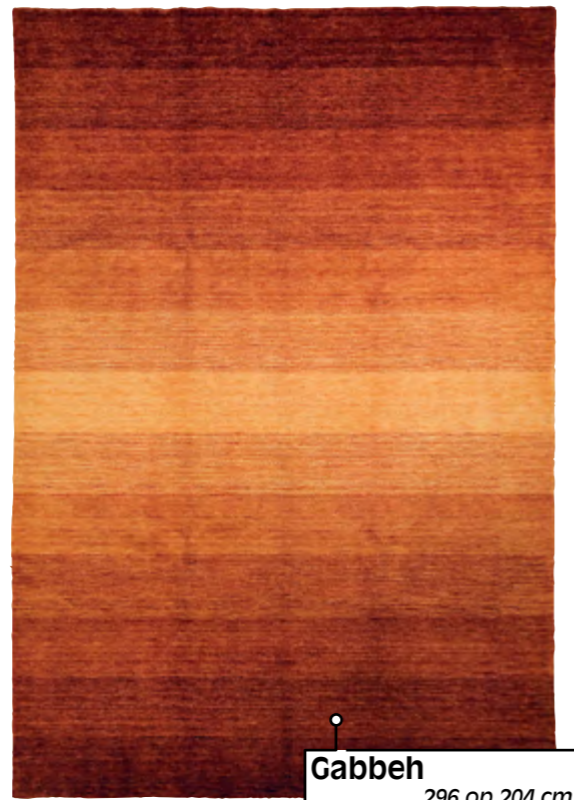
Gabbeh 296 op 204 cm superpromo

deze week ALLES AAN speciale opendeur- prijzen!