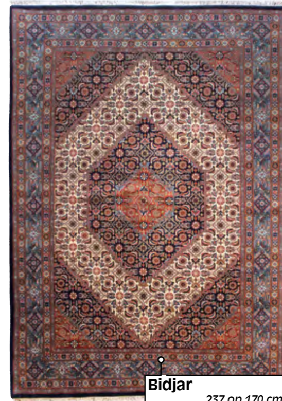
Bidjar 237 op 170 cm €-4900 nu € 1700