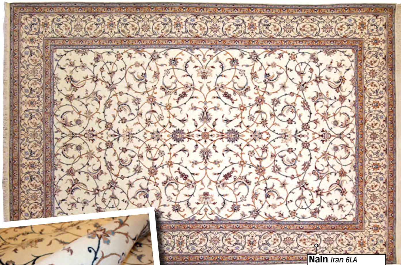
Nain Iran 6LA 321 op 218 cm