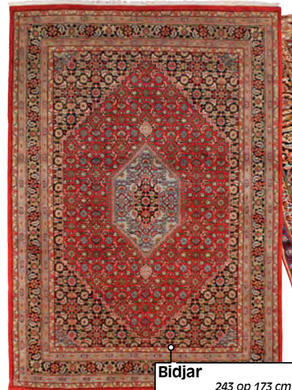
Bidjar 243 op 173 cm €-5560 nu € 1830