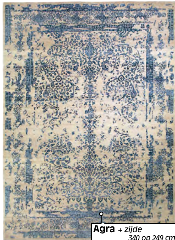
Agra + zijde 340 op 249 cm superpromo