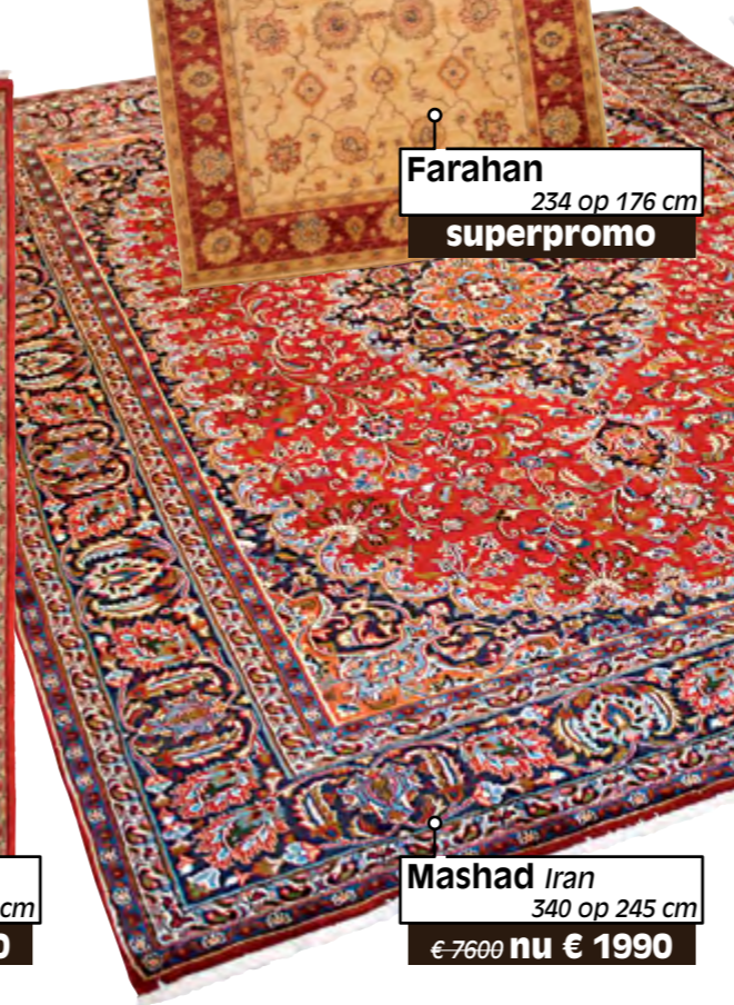
Mashad Iran 340 op 245 cm €-7600 nu € 1990