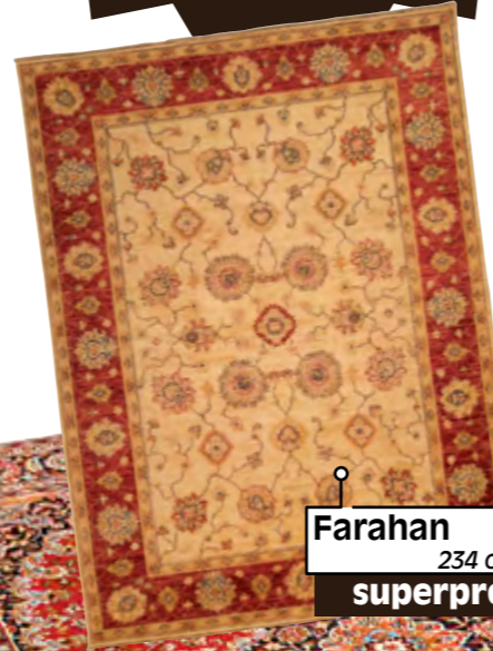
Farahan 234 op 176 cm superpromo

deze week ALLES AAN speciale opendeur- prijzen!