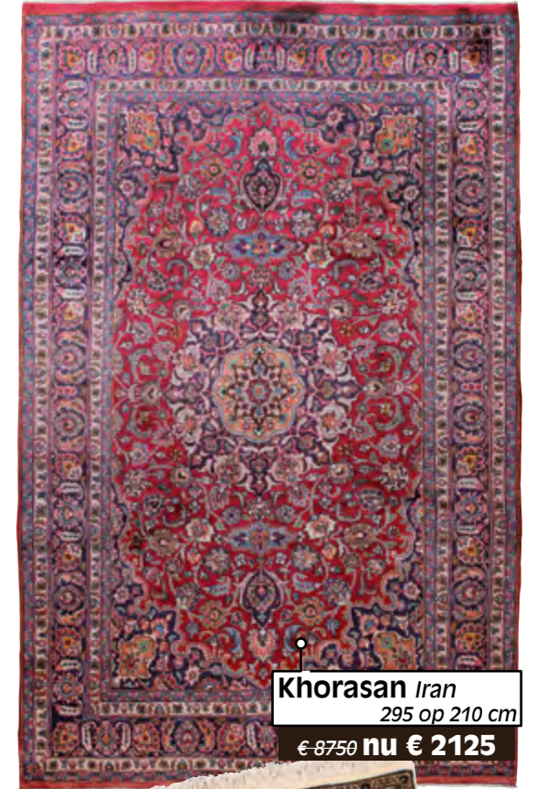
Khorasan Iran 295 op 210 cm €-8750 nu € 2125