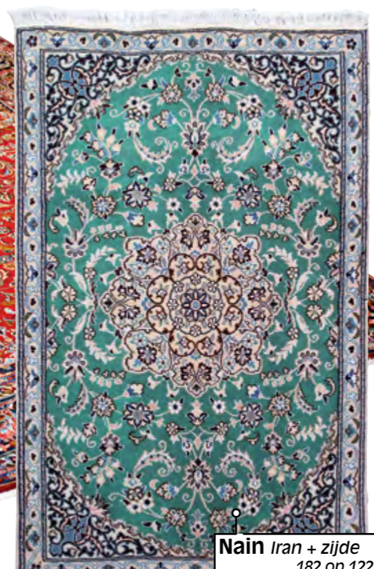
Nain Iran + zijde 182 op 122 cm €-2690 nu € 669