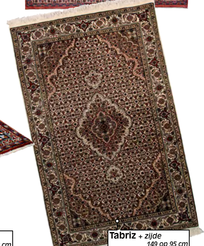
Tabriz + zijde 149 op 95 cm superpromo