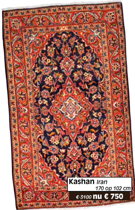
Kashan Iran 170 op 102 cm €-3100 nu € 750

kom zien, voelen en genieten tijdens de opendeurdagen